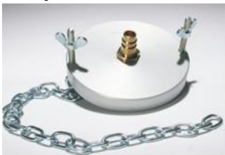
Adapter: U 90 K/U 100 K