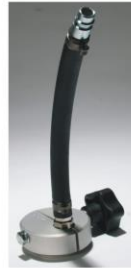
Adapter: 3 O-Serie