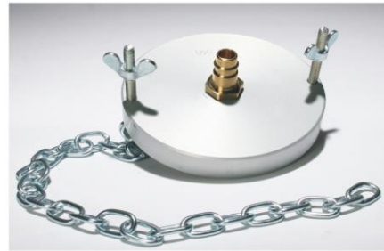
Adapter: U90/U100 K