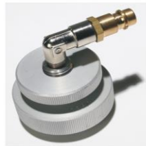
Adapter: BS/BS W-Serie