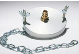
Adapter: U 90 K/U 100 K