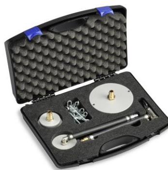
Adapterkoffer Profi klein