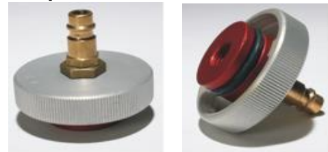
Adapter: E 20 W